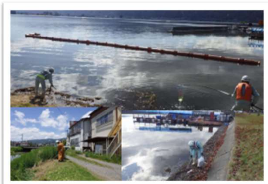
現場周辺清掃の様子