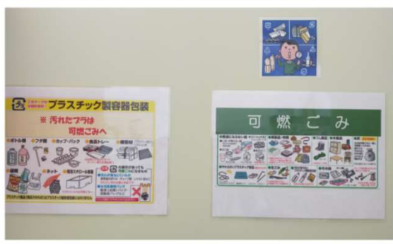
社内での取り組み 分別の徹底