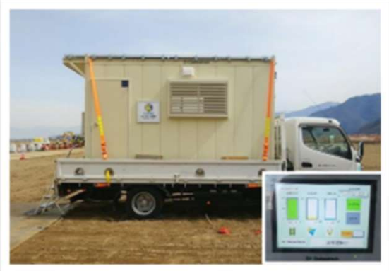
ソーラー発電を利用し 自然エネルギーの活用