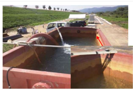
地下水利用し 水の使用の抑制