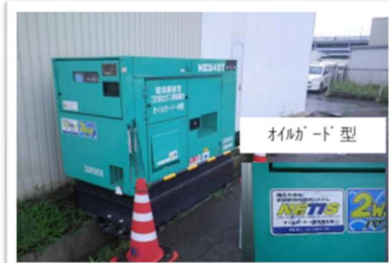
環境配慮型発電機の使用により油 流出防止の実施